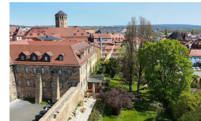
Regierungsgebäude und Garten

Wir engagieren uns für attraktiven, modernen und bezahlbaren Wohnraum und fördern diesen – die Grundlage dafür, dass Jung und Alt gerne in Oberfranken leben.