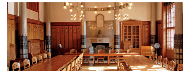
Landratssaal im Regierungsgebäude

Wir bieten mit dem Widerspruchsverfahren insbesondere in Teilen des Sozialrechts einen kostengünstigen und effektiven Rechtsschutz. Allgemeinen Beschwerden gehen wir nach.